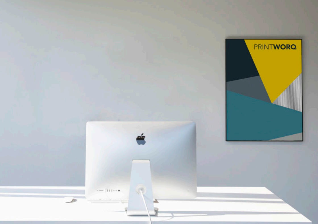
De bestelbare sample